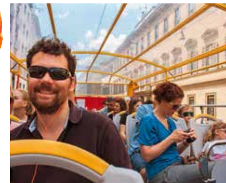
wireltern 3/2014 Bilder: thinkstock, © ppi09 - Fotolia.com Illustrationen: Gabriela Gründler

Das Ristorante Farinella an der Via Foro Bonaparte 71 ist an Wochenenden mit Kinderwagen vollgestopft und bietet Hochstühle und Malsachen an. Wer vor lauter Sightseeing, Kultur und Shopping eh keine Zeit zum Essen hat, holt sich im Luini (Via Santa Radegonda 16) eine der köstlichen Panzerotti für unterwegs.